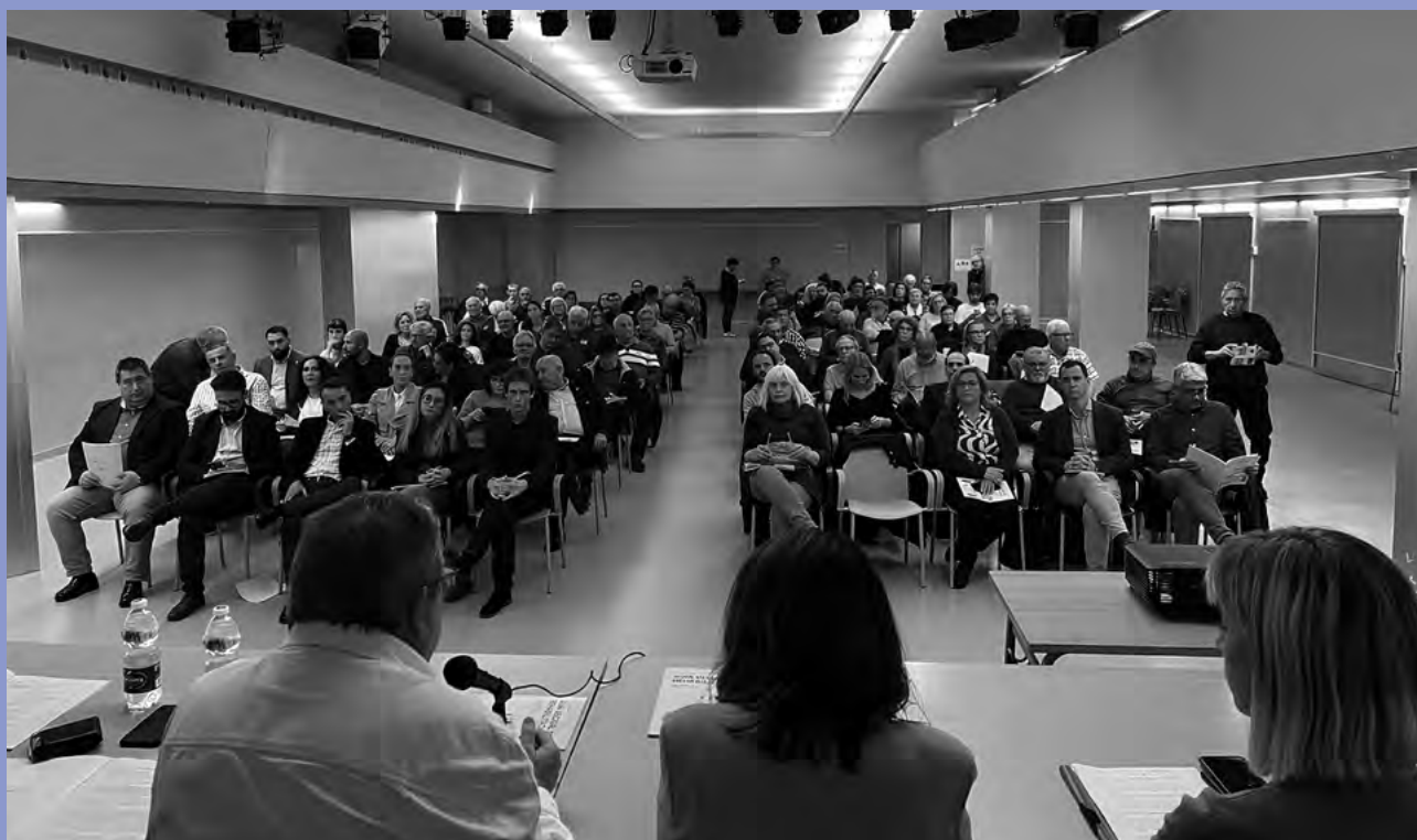
PRESENTACIÓN DE LA GUÍA EN BADALONA EL 09/04/2024