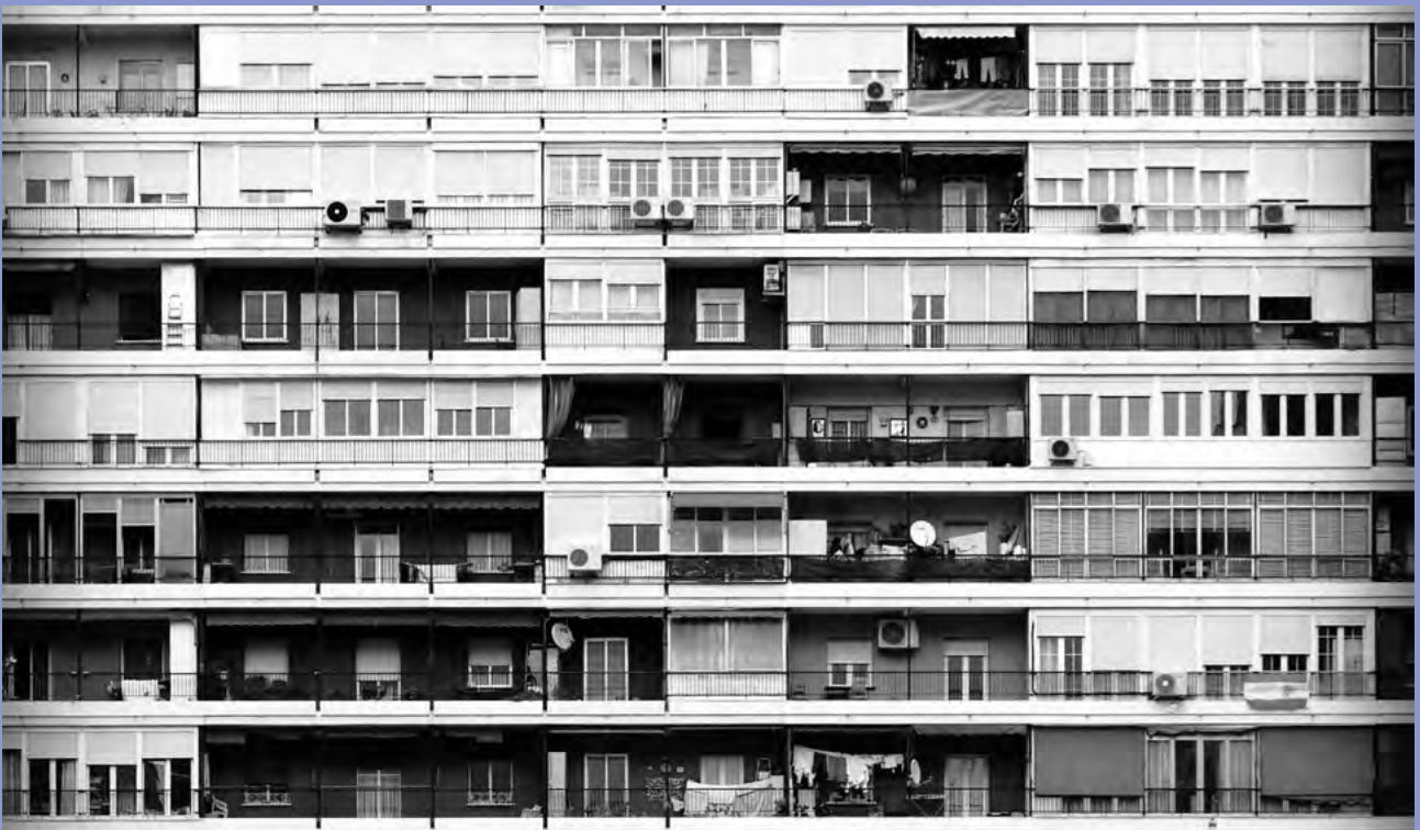
EDIFICIO DE VIVIENDAS EN ESPAÑA