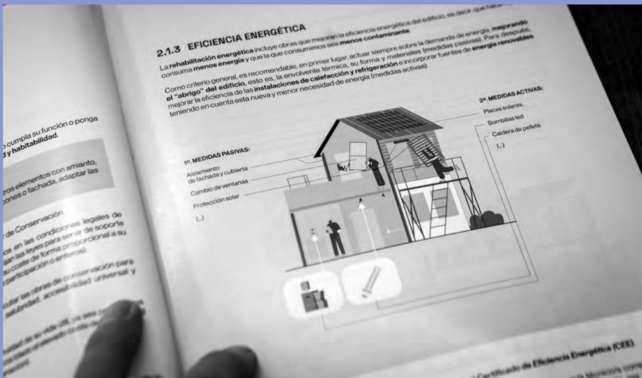
IMAGEN DE LA GUÍA VECINAL DE REHABILITACIÓN

La Administración local no conoce en profundidad su parque edificado, por lo que no cuenta con objetivos planificados de regeneración ni rehabilitación.