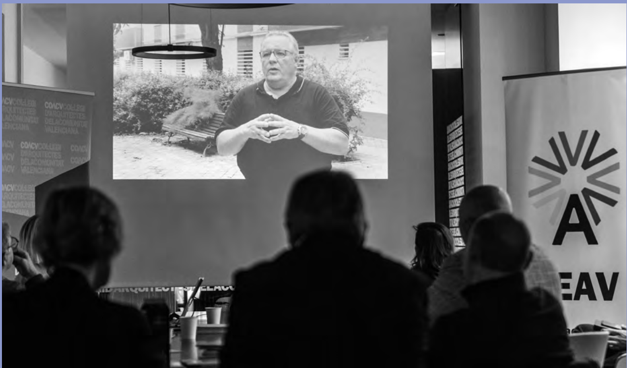
PRESENTACIÓN DE LA GUÍA EN VALENCIA EL 11/12/2023