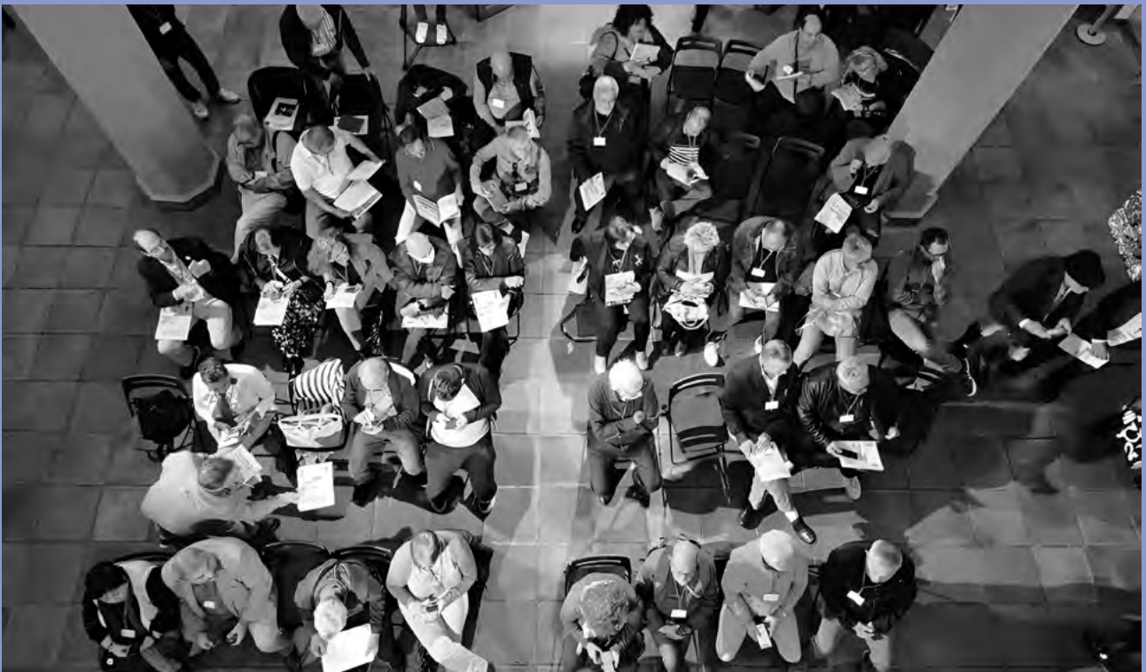
PRESENTACIÓN DE LA GUÍA EN ZARAGOZA EL 28/10/2023