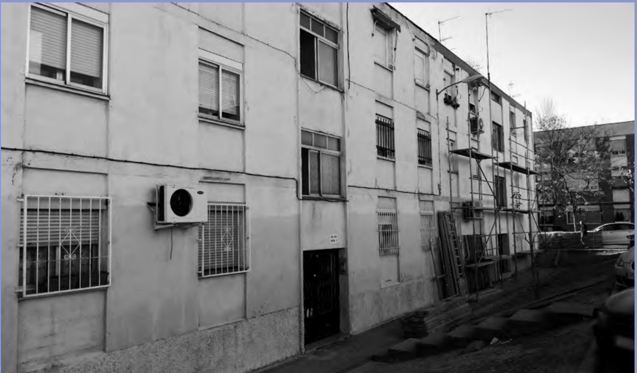
BARRIADA DEL AEROPUERTO DE MADRID ANTES DE SU REHABILITACIÓN